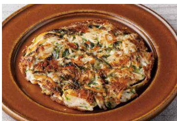
大和芋とグリエールのロスティ

Charcoal-grilled Awaji Octopus And Inca Wake Salsa Verde 1,091 (税込 1,200)