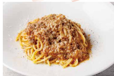
淡路牛のボロネーゼ

Oil Pasta With Wild Shrimp And Kujo Leeks 1,636 (税込 1,800)