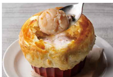
貝柱とキノコのパイ包み焼き

Baked Scallops And Mushrooms In Pie Wrapper