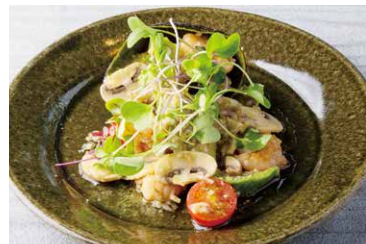
海老とアボカドのサラダ仕立て

Shrimp And Avocado Salad 1,073 (税込 1,180)