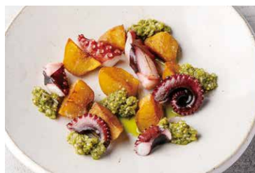
淡路産タコの炭火焼きと インカの目覚めサルサヴェルデ

Shrimp And Avocado Salad 1,073 (税込 1,180)