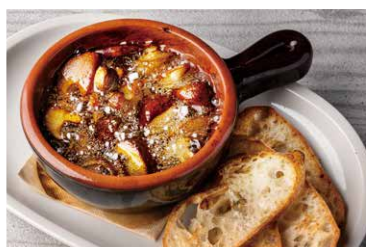
神山椎茸とマッシュルームの アヒージョ

Yamatoimo and Gruyere Cheese Rosti 727 (税込 800)