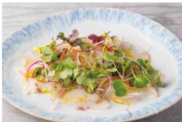
本日鮮魚のカルパッチョ

Mozzarella Bufala And Seasonal Fruits 1,182 (税込 1,300)