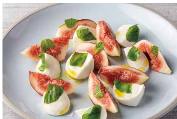
モッツアレラ ブッフアラと 季節のフルーツ

Mozzarella Bufala And Seasonal Fruits 1,182 (税込 1,300)