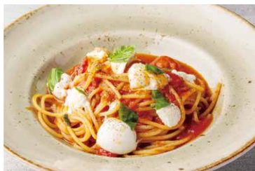
フレッシュトマトと モッツアレラのパスタ

Pasta With Fresh Tomato And Mozzarella 1,455(税込 1,600)