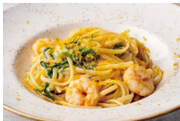
天然海老と九条ネギの オイルパスタ

Pasta With Fresh Tomato And Mozzarella 1,455(税込 1,600)