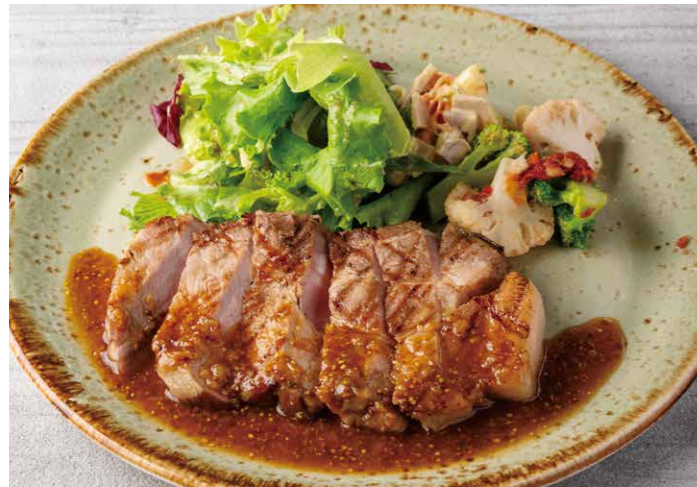
週替わりメイン メインのみ ¥1,182 (税込 ¥1,300) WEEKLY MAIN