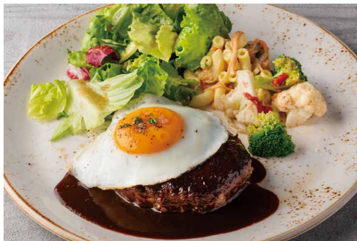
淡路産牛ハンバーグ メインのみ ¥1,318 (税込 ¥1,450) BEEF HAMBURGER STEAK