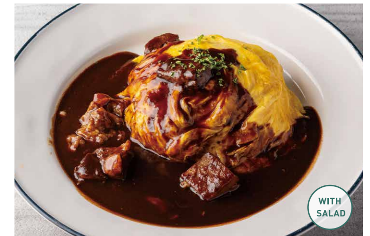
ゴロゴロ牛肉のオムライス サラダ付 ¥1,318 (税込 ¥1,450) RICE OMELET WITH BEEF