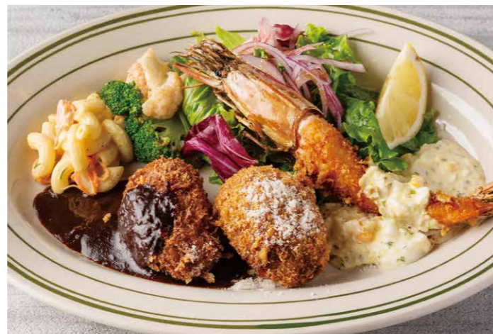
ミックスフライ メインのみ ¥1,318 (税込 ¥1,450) MIXED FRY LUNCH