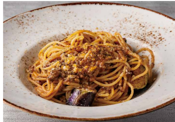
週替わりパスタ メインのみ ¥1,091 (税込 ¥1,200) WEEKLY PASTA