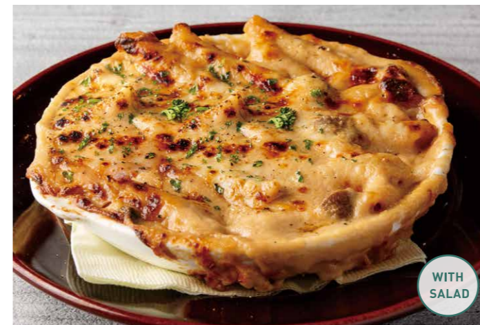
天然海老のペンネグラタン サラダ付 ¥1,409 (税込 ¥1,550) SHRIMP GRATIN